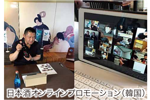
日本酒オンラインプロモーション(韓国)