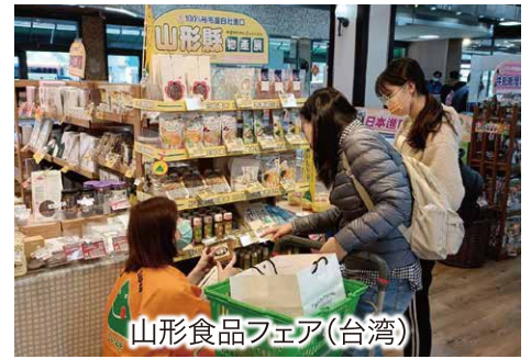
山形食品フェア(台湾)