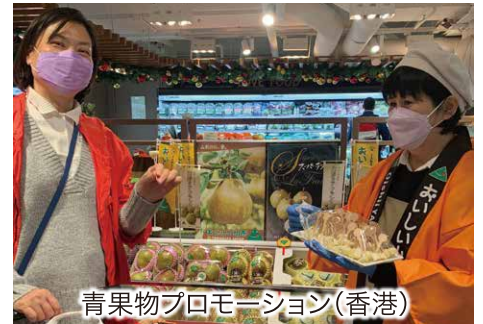
青果物プロモーション(香港)